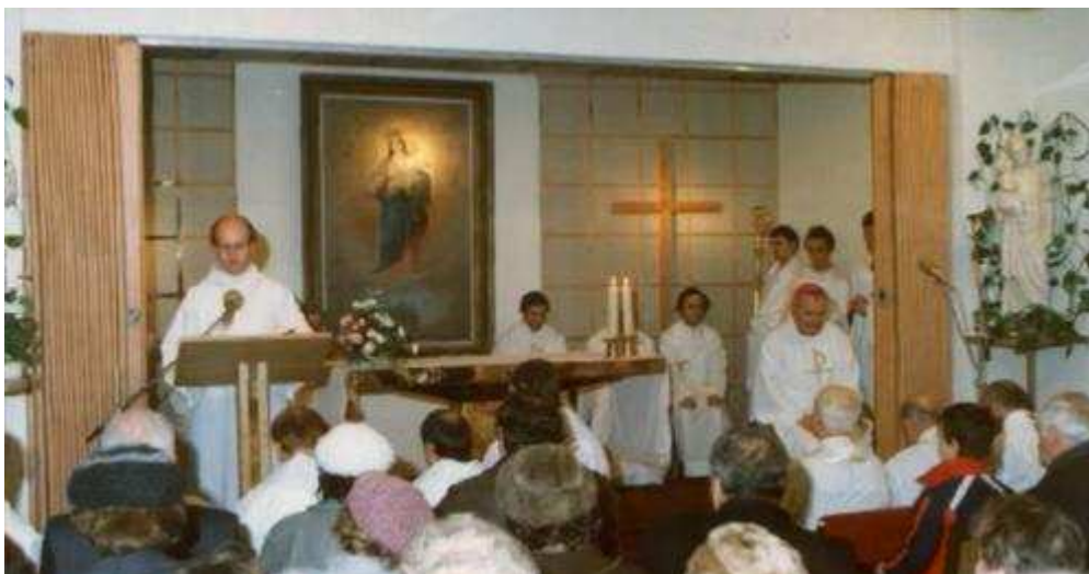
Foto z původní kaple salesiánské oratoře