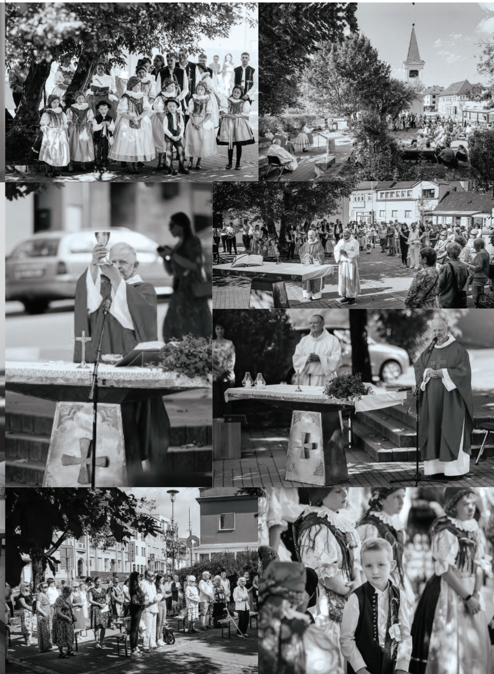
Svatováclavská hodová mše