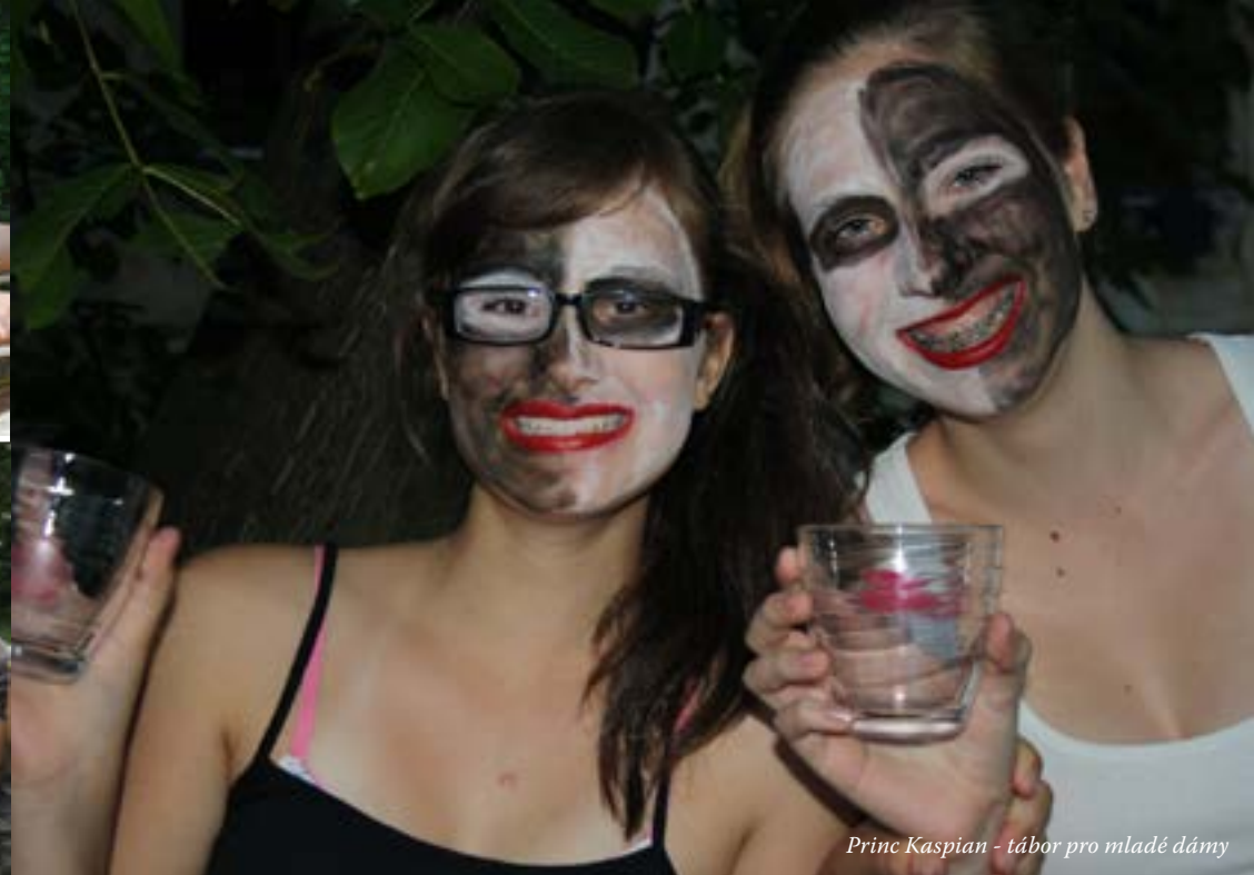
Princ Kaspian - tábor pro mladé dámy