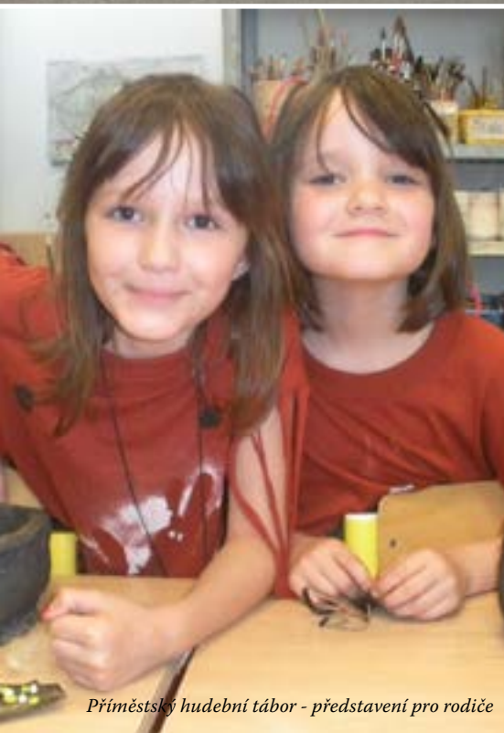
Příměstský hudební tábor - představení pro rodiče