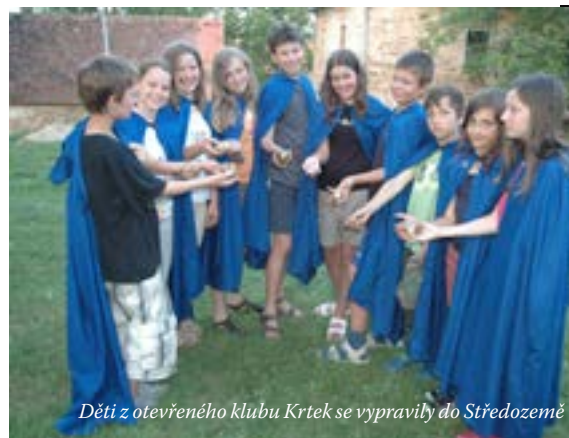
Děti z otevřeného klubu Krtek se vypravily do Středozemě

tábor ani Sporták pro kluky z fotbalových kroužků. Další tábor patřil ministrantům, jiný mladým dámám a další muzicírujícím dětem. Starší táborníci vyrazili na kolo i na vodu.