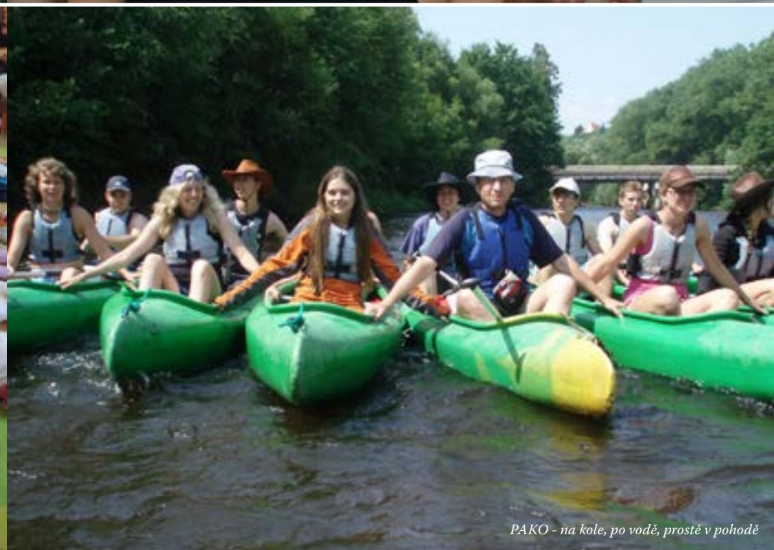
PAKO - na kole, po vodě, prostě v pohodě