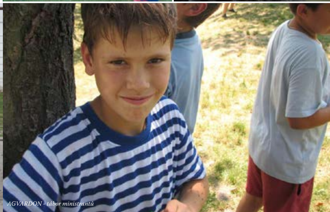
AGVARDON - tábor ministrantů