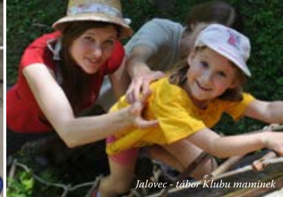
Jalovec - tábor Klubu maminek