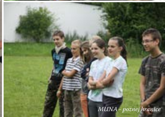
MUNA - poznej hranice