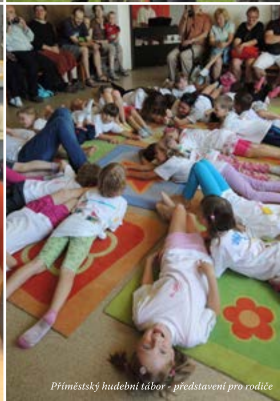
Příměstský hudební tábor - představení pro rodiče