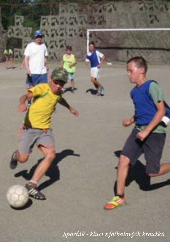
Sporták - kluci z fotbalových kroužků