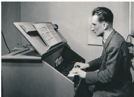
Hraji na staré píšťalové varhany, které prý byly k salesiánům převezeny z vybombardovaného kostela na Grohove. Fotka je z roku 1952, je mi 19 let. Poznávám noty, hraji asi něco z Bacha.